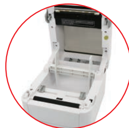
简易操作 方便维护